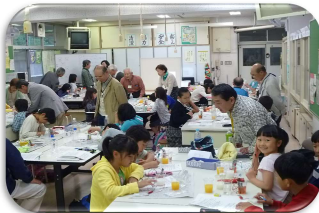
(「鉛筆充電機」の科学体験塾会場風景)